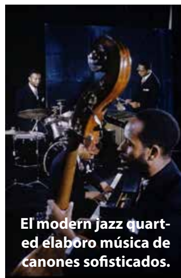
El modern jazz quartet elaboro música de canones sofisticados.

lo describe Billie Holiday en Strange Fruit, que dura canción.... Ahora la opinión pública en general sabía lo que ocurría, es entonces cuando entra en acción el presidente Kennedy en los sesenta.